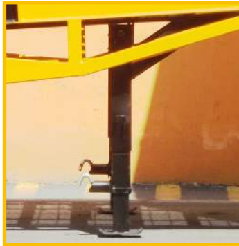
GATO MANIVELA MECANICA