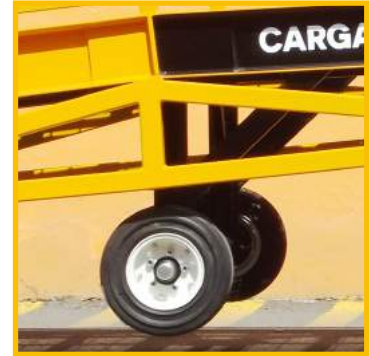
RUEDA 16" SOLIDEAL